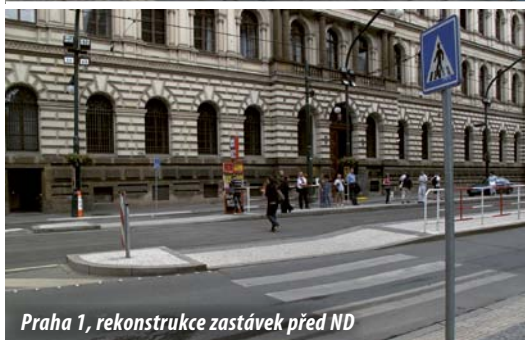
Praha 1, rekonstrukce zastávek před ND