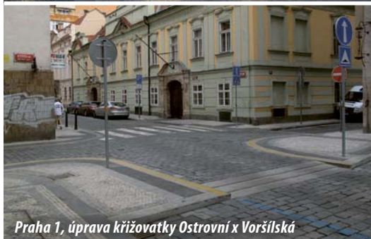
Praha 1, úprava křižovatky Ostrovni x Voršílská