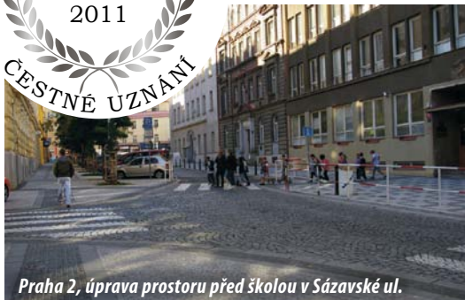
Praha 2, úprava prostoru před školou v Sázavské ul.