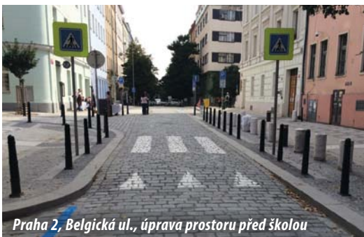
Praha 2, Belgická ul., úprava prostoru před školou