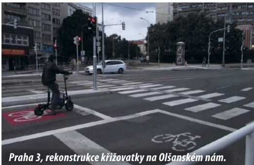
Praha 3, rekonstrukce křižovatky na Olšanském nám.