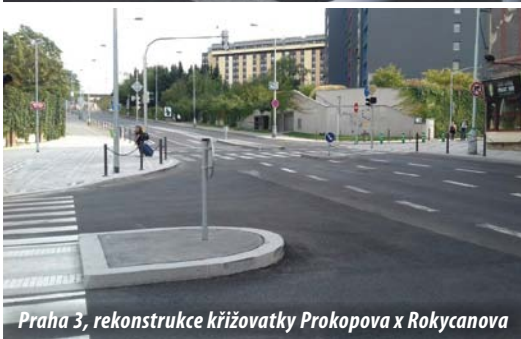
Praha 3, rekonstrukce křižovatky Prokopova x Rokycanova