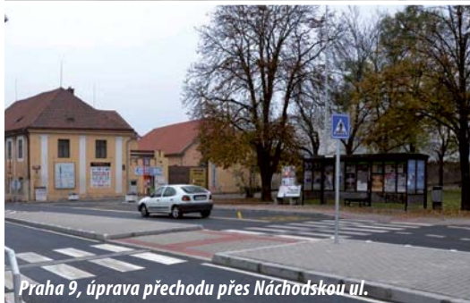
Praha 9, úprava přechodu přes Náchodskou ul.

Program Bezpečné cesty do školy je nositelem těchto ocenění: