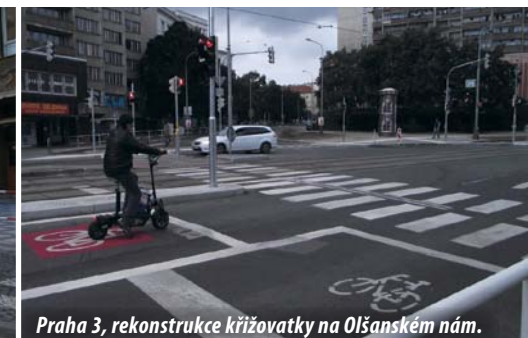
Praha 3, rekonstrukce křižovatky na Olšanském nám.