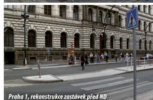
Praha 1, rekonstrukce zastávek před ND