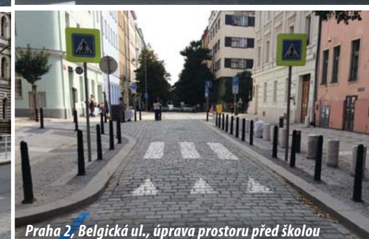
Praha 2, Belgická ul., úprava prostoru před školou