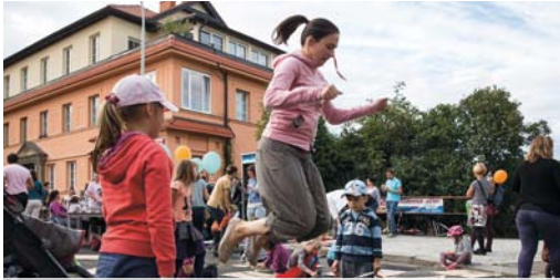
Bezpečné a přívětivé ulice nejen pro děti, zapojení široké občanské komunity

Děti potřebují pohyb, dopřejme jim ho. Děti mají dobré nápady, dejme jim slovo. Děti chtějí být samostatné, podpořme je v tom.