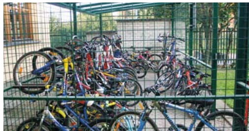
Přístřešky a stojany na kola