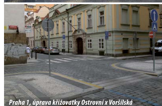
Praha 1, úprava křižovatky Ostrovní x Voršílská