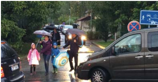
Méně dopravního chaosu a kvalitní veřejná prostranství před školami