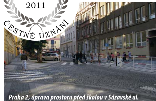
Praha 2, úprava prostoru před školou v Sázavské ul.

Více než 80 realizovaných opatření pro větší bezpečnost chodců po celé Praze