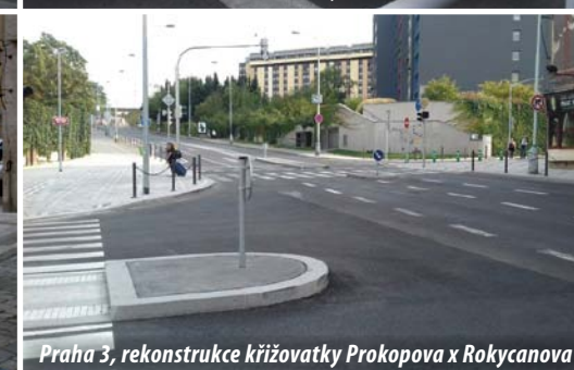
Praha 3, rekonstrukce křižovatky Prokopova x Rokycanova