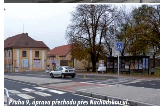
Praha 9, úprava přechodu přes Náchodskou ul.

Program Bezpečné cesty do školy je nositelem těchto ocenění: