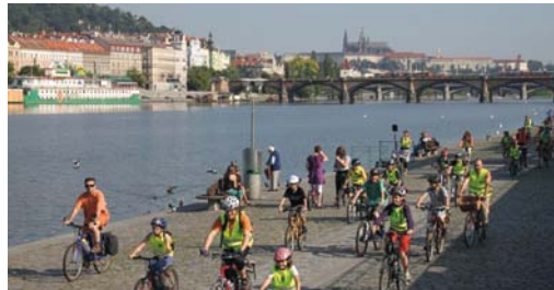
Pěší dny, cyklojízdy, pěšibusy, přednášky, výtvarné a literární soutěže

Ilustrace Petra Cířkové, foto Lukáš Žentel, Štěpán Hon, Květoslav Sýrový a archiv PM