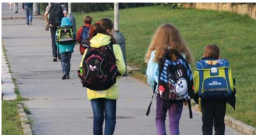
Více dětí, které chodí do školy pěšky nebo jezdí na kole