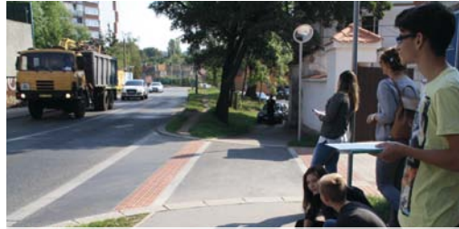
Podpora samostatnosti a odpovědnosti dětí, dopravní a environmentální výchova v praxi