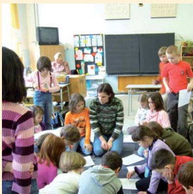
Mapování na ZŠ Jiřího z Poděbrad