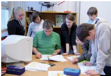
Měření prachu na ZŠ Sázavská

Projekt pokračuje i v roce 2008, v jeho závěru budou výsledky měření prezentovány samotnými dětmi.