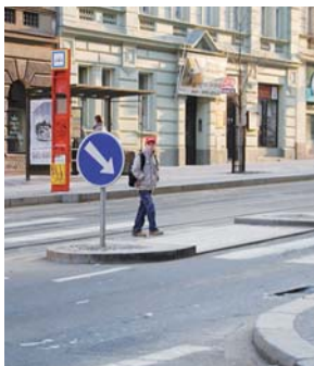
Rekonstrukce křižovatky Korunní–Šumavská