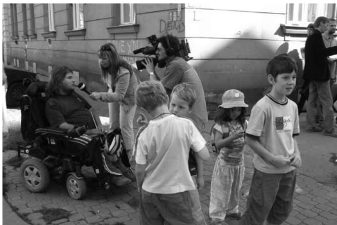
Tisková beseda k modrým zónám

mi ulicemi pořádaném v rámci Evropského týdne mobility jsme poukázaly na špatné parkování v hlavním městě a nutnost jej postihnout. Vystoupením na Výboru pro zahraniční věci, obranu a bezpečnost Senátu ČR jsme přispěly k navrácení kompetence městské policie měřit rychlost automobilů v obcích. Zprostředkováním argumentace (zejména statistik týkajících se prašnosti) a otevřeným dopisem starostce MC Praha 2 jsme napomohly také ke zúžení SJ magistrály. Na podzim během požáru v libušské tržnici jsme v otevřeném dopise primátoru Bémovi upozornily na slabiny krizového řízení hlavního města.