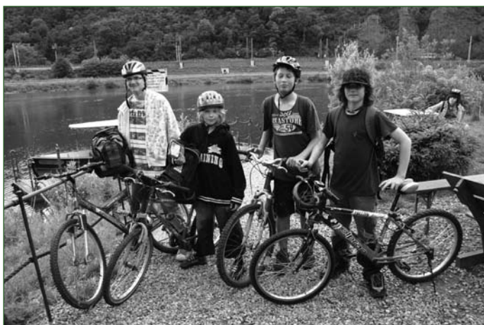
Cyklovýlet ZŠ Korunovační (kola byla pořízena v rámci projektu Bezpečné cesty do školy)