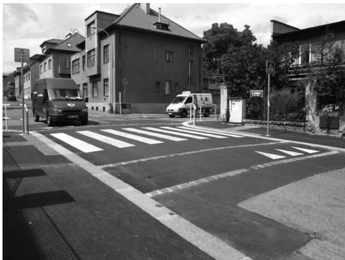
Integrovaný přechod u křižovatky Na Stírce x Okrouhlická v Praze 8

V rámci členství v této pracovní skupině se Pražské matky zabývají především bezpečností chodců a cyklistů v pražských ulicích. V roce 2008 jsme ovlivnily výši rozpočtu pro BESIP, jehož součástí je i program Bezpečné cesty do školy (BCS). Působením ve skupině jsme v uply-