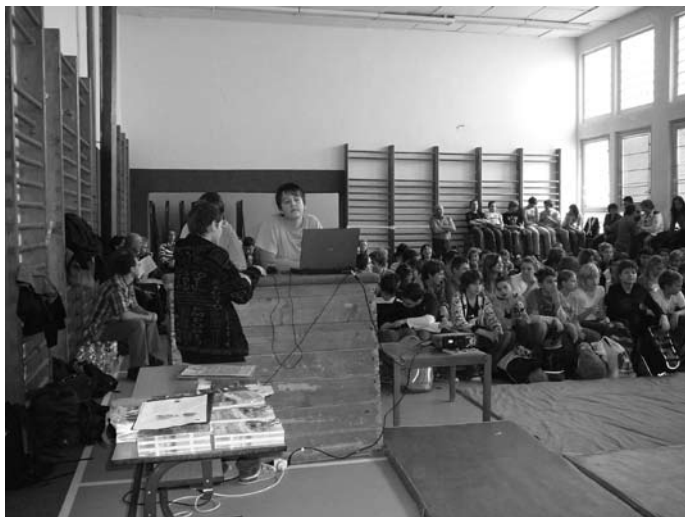
Žákovská prezentace projektu Vím, co dýchám

Na začátku listopadu 2008 se uskutečnila závěrečná tisková konference, kde děti představily průběh a výsledky projektu spolužákům, zástupcům veřejné správy a médií. Pražské matky rozeslaly do pražských základních škol osvětovou příručku Vím, co dýchám aneb co chcete vědět o ovzduší zpracovanou v rámci projektu pracovníky Zdravotního ústavu.